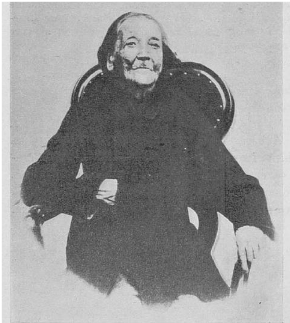
Послѣдній портретъ Н. А. Дуровой. Изъ собр. портретовъ уланск. Литовскаго полка.